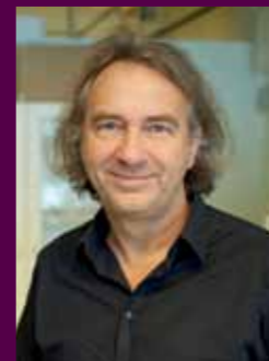
Prof. Christian Schubert

Die Trennung von Leib und Seele (Dualismus) sowie die vollständige Rückführbarkeit des Ganzen auf seine Einzelteile (Reduktionismus) mitsamt der damit verbundenen mechanistisch-reduktionistischen Forschungszugänge werden so zu Proponenten eines klar veralteten Erkenntniszugangs der Biomedizin.